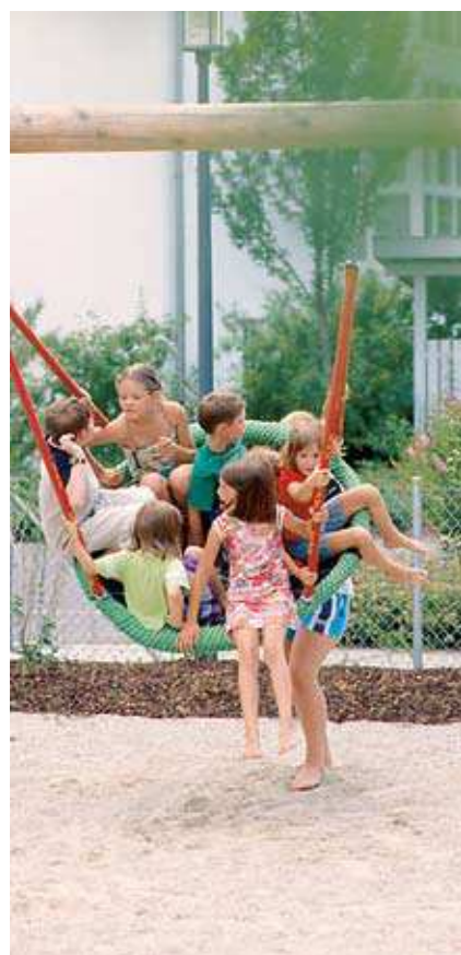
La Balançoire Nacelle La Balançoire Nacelle spéciale

Réf. 6.14500 - Balançoire nacelle spéciale