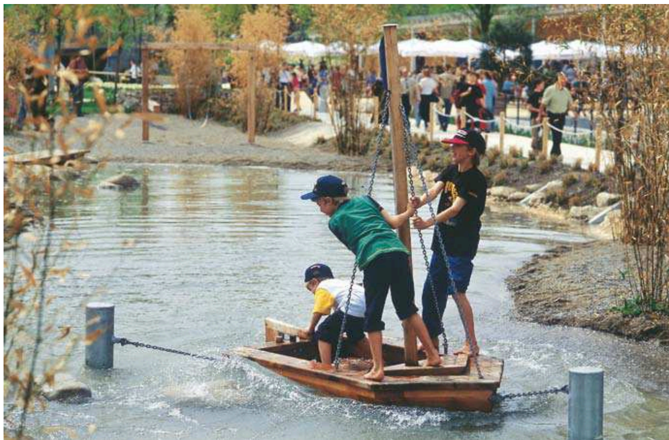
Réf. 6.03201 Bateau à voile avec poteaux acier