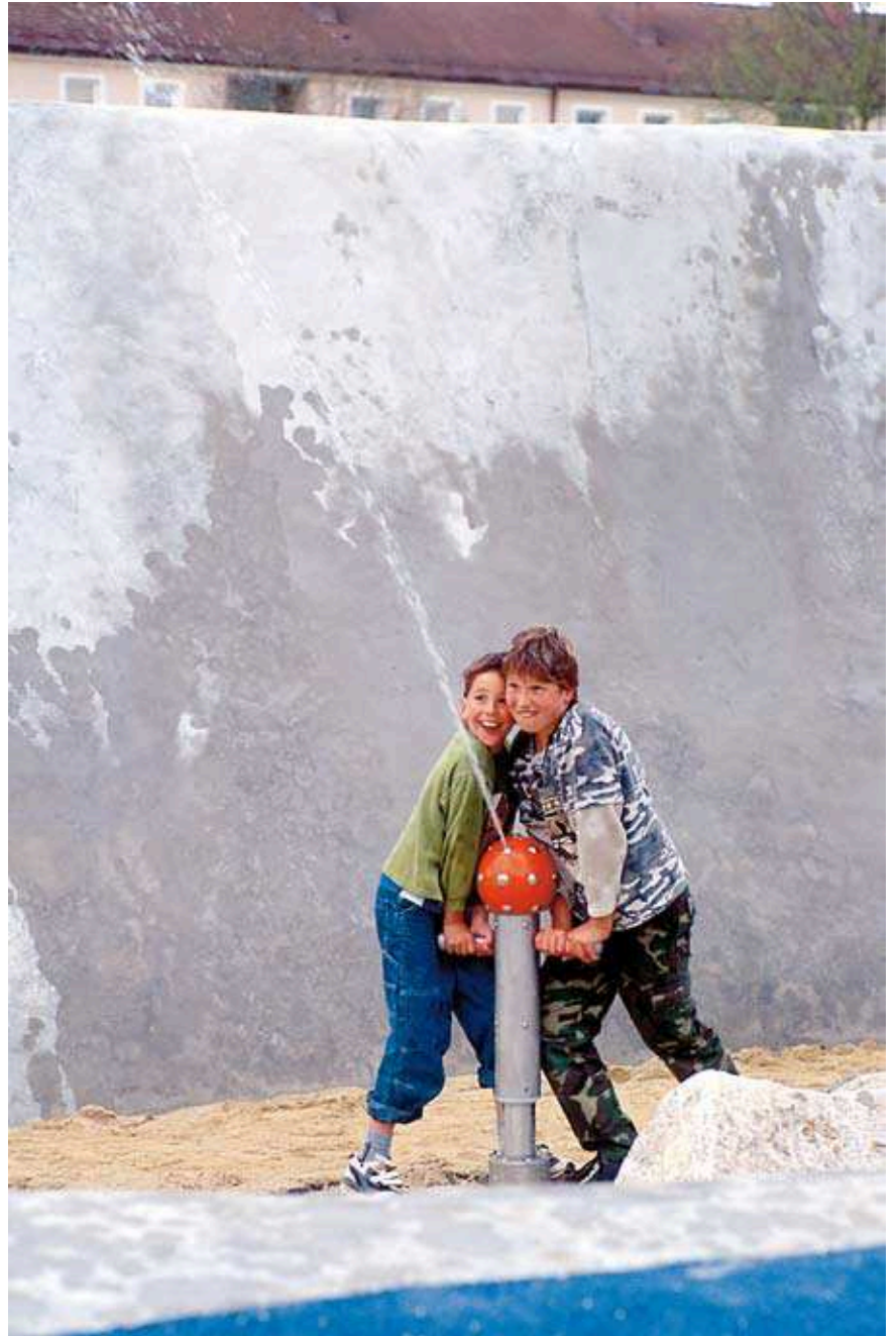
Cette photo montre la version à tête rotative

Pompe à jet d'eau avec tête fixe Pompe à jet d'eau avec tête rotative Réservoir d'eau