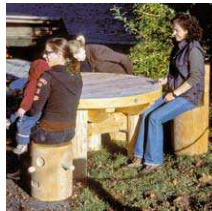
Réfs 4.40000 Table ronde et 4.40050 tabouret avec dossier

Les enfants adorent les meubles qui sont construits pour eux. La grande table ronde aux contours soignés présente aussi une belle finition. Avec ses 8 bancs disposés tout autour, elle peut réunir jusqu'à 20 personnes, les petits comme les grands. Elle offre un espace parfait pour faire des jeux de société, mais aussi pour faire ses devoirs, ou bien encore partager un repas à plusieurs et pourquoi pas, pousser la chansonnette... Une table ronde, même avec dimensions réduites, favorise les activités en commun.