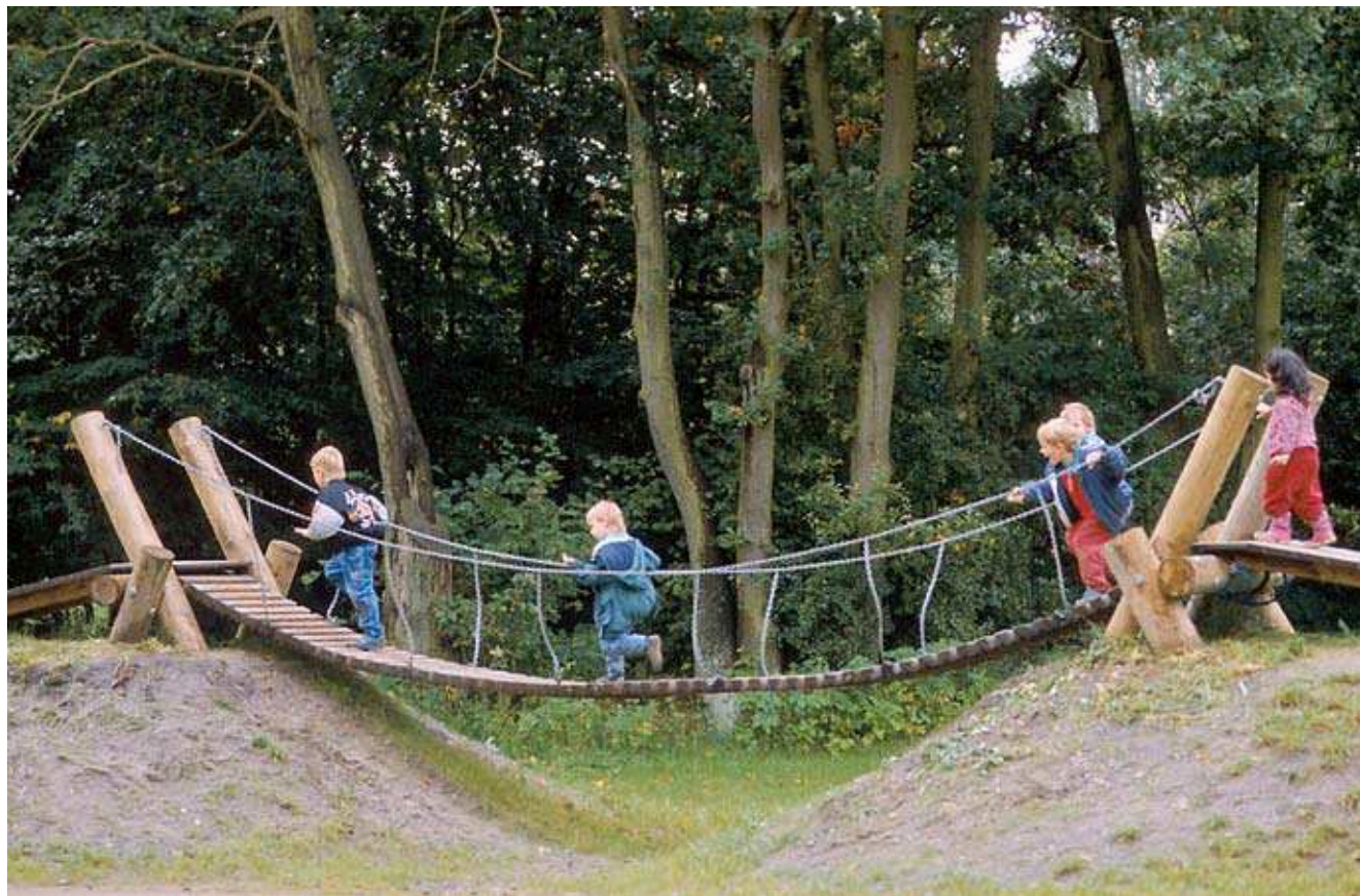
Version spéciale avec 2 rampes d'accès