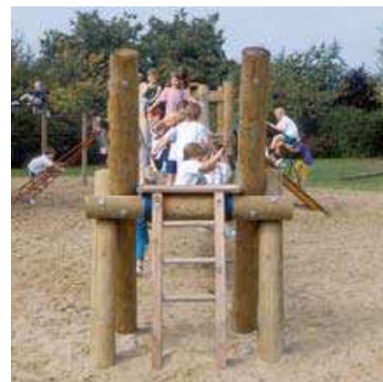
Version standard munie d'une échelle

Les ponts suspendus structurent à merveille les espaces de jeux. En plus de cette qualité intrinsèque, leur apparence fragile (à première vue) ainsi que leur caractère dynamique en font des éléments très attractifs pour tous. Aussi, rares sont les cas où ils sont laissés de côté par les enfants et plus d'une fois on verra le promeneur adulte détourner son chemin pour les essayer.