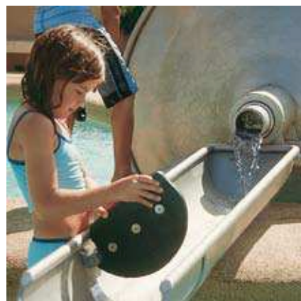
Le Nautille Avec Gouttière et roue de puisage