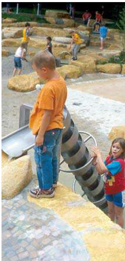
Vis d'Archimède avec différents mécanismes d'entraînement