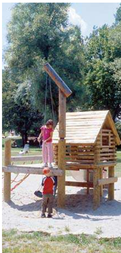
Réf. L4.14910 - Maison avec terrasse en rondins coupés