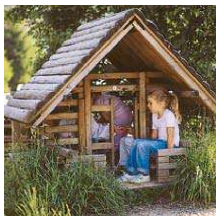
Réf. 4.10110 avec porte

Maisonnette Grande maison Maisonnette avec porte Grande maison avec porte